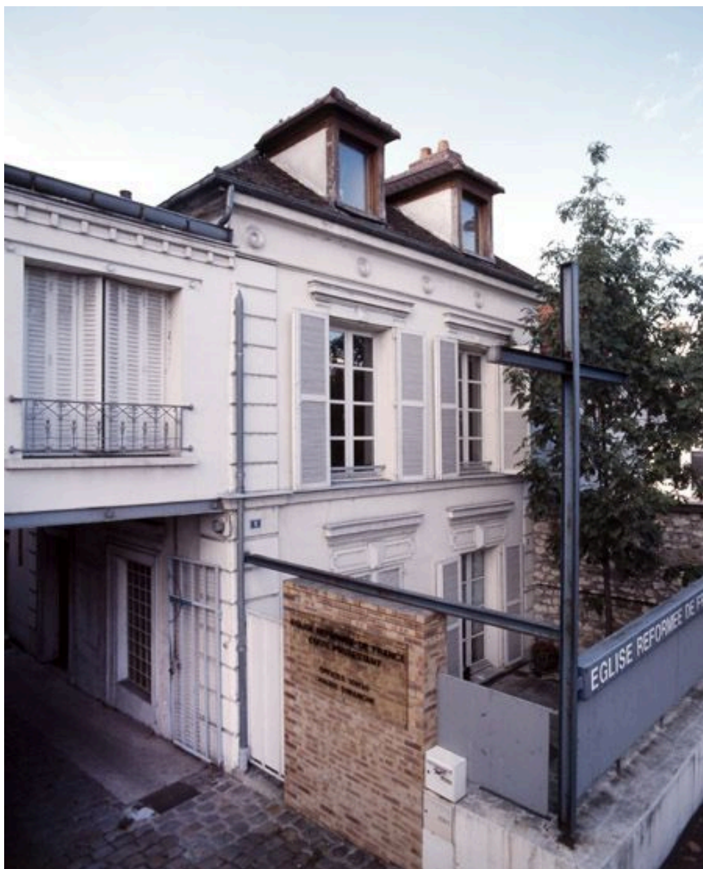
Maison servant actuellement de presbytère protestant : la façade sur l'avenue Thiers.