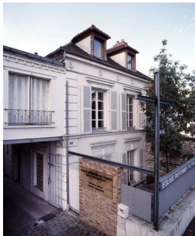
Maison servant actuellement de presbytère protestant : la façade sur l'avenue Thiers. IVR11_20057700476XA