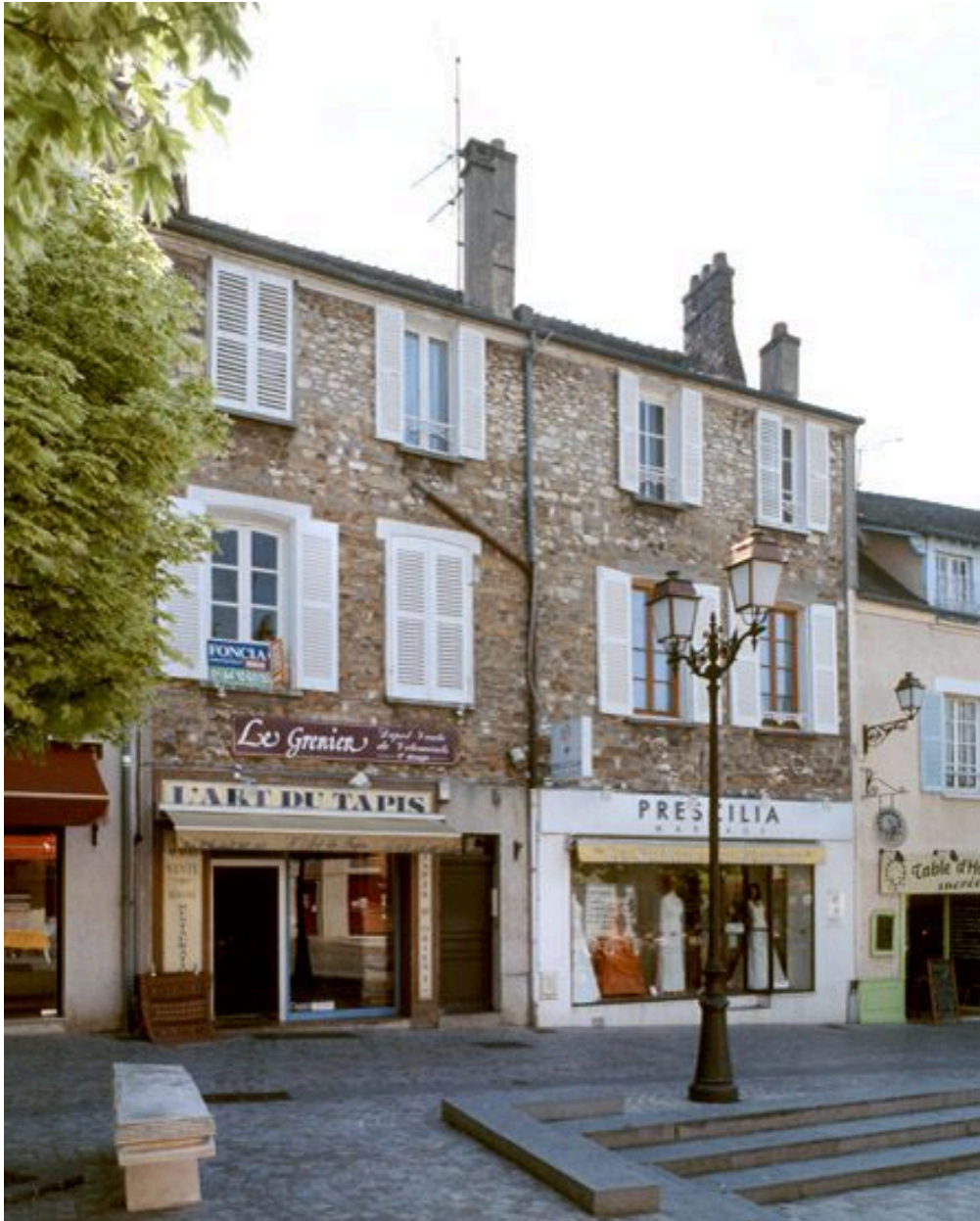
Vue de la façade.