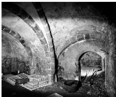
La cave : vue prise depuis l'angle nord-ouest. IVR11_20027700742X