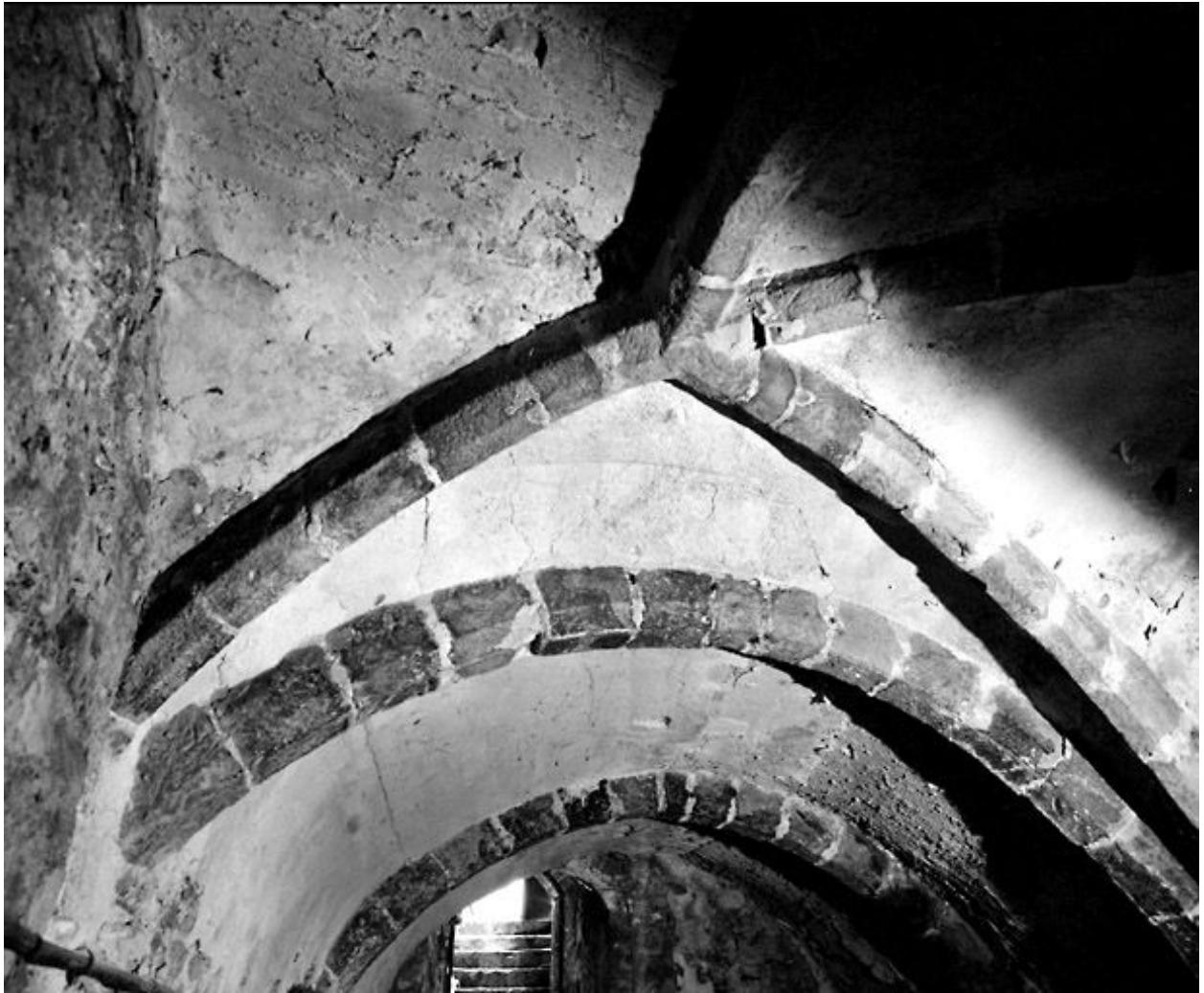
La cave : vue depuis l'ouest, avec la voûte d'ogives.