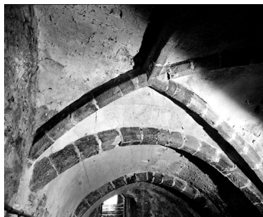
La cave : vue depuis l'ouest, avec la voûte d'ogives.