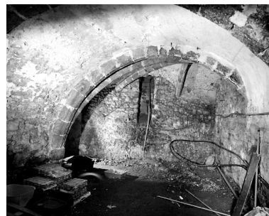
La cave : vue depuis l'entrée. IVR11_20027700743X