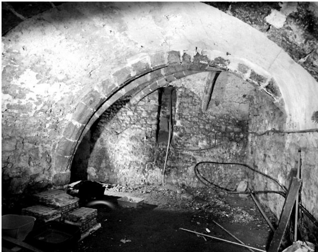
La cave : vue depuis l'entrée.