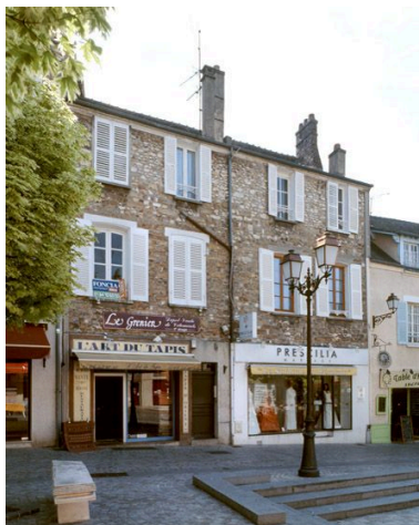
Vue de la façade. IVR11_20057700248VA