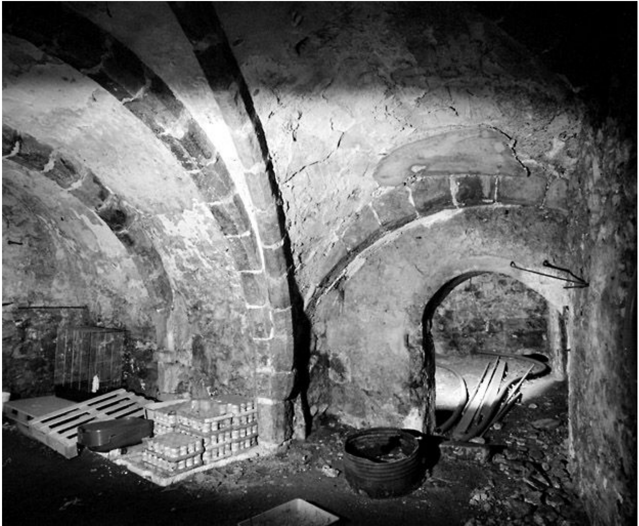
La cave : vue prise depuis l'angle nord-ouest.