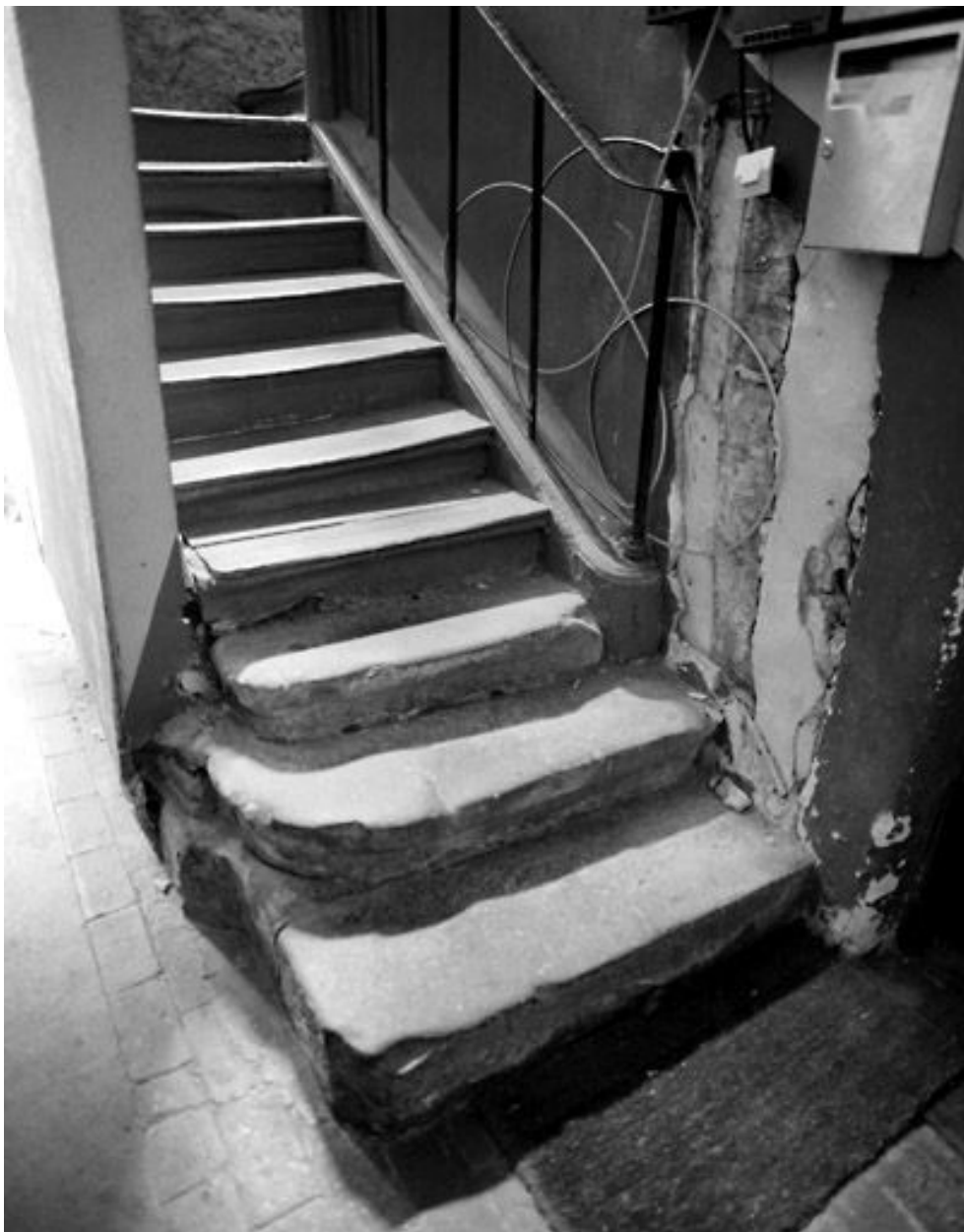
Départ de l'escalier.