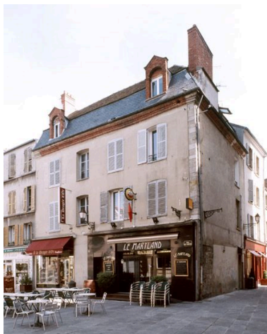
Vue d'ensemble. IVR11_20057700233VA