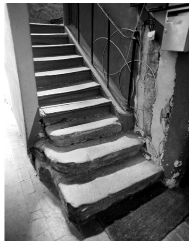
Départ de l'escalier. IVR11_20027700748X