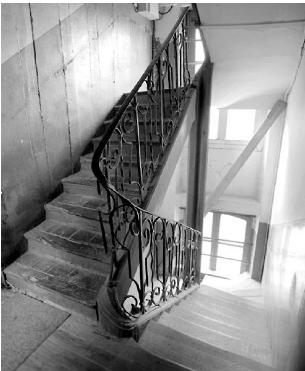
Vue de l'escalier en fer forgé.