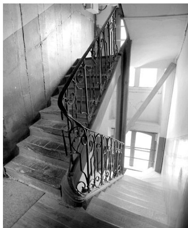
Vue de l'escalier en fer forgé. IVR11_20027700749X